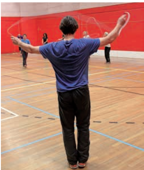
▶ foto 3 basic jump