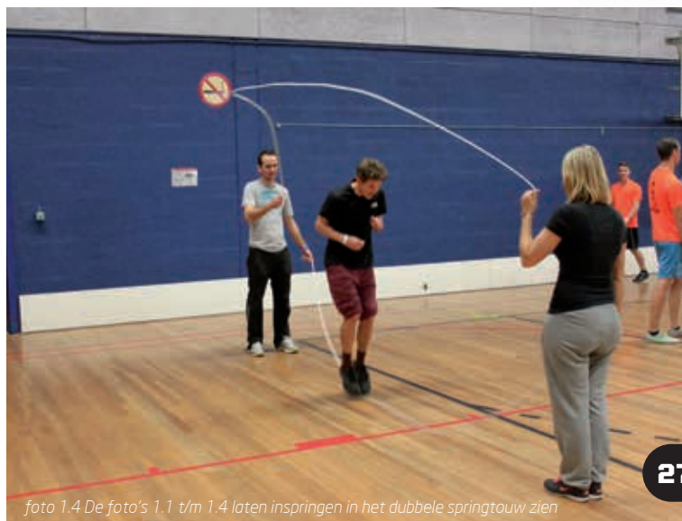
foto 1.4 De foto's 1.1 t/m 1.4 laten inspringen in het dubbele springtouw zien